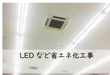
LEDなど省エネ化工事