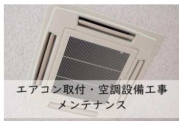
エアコン取付・空調設備工事 メンテナンス