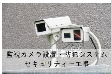
監視カメラ設置・防犯システム セキュリティー工事