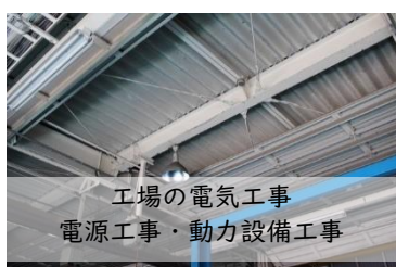
工場の電気工事 電源工事・動力設備工事